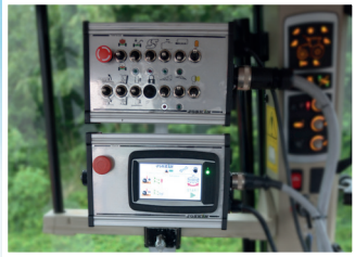
Skrzynka sterownicza w kabinie + ekran Touch-Control

WÓZ PRZYGOTOWANY DO RÓŻNEGO OSPRZĘTU ROZLEWAJĄCEGO (RAMP I APLIKATORÓW)