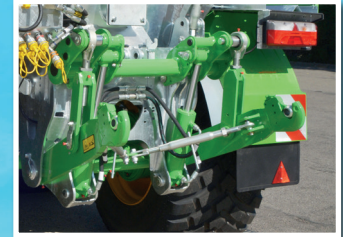
Zintegrowany podnośnik i wyposażenie hydrauliczne „Automate 2+4”